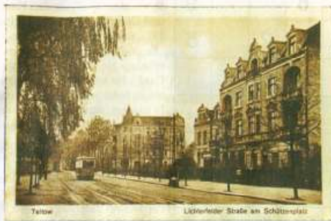
So sah der Schützenplatz einst aus, dessen Gebäude den Bomben des Zweiten Weltkrieges zum Opfer fielen.

Es ist der erste Hinweis auf dieses Kapitel in der Stadtgeschichte. Schwierig gestaltete sich bereits die Suche nach einstigen jüdischen Nachbarn, an deren Schicksale im Rahmen eines Stolpersteinprojektes erinnert werden soll. Noch vor zwei Jahren meinten einige Teltower, in der Stadt hätte es kaum Juden gegeben. Höchstens zwei, so versicherten Alt-